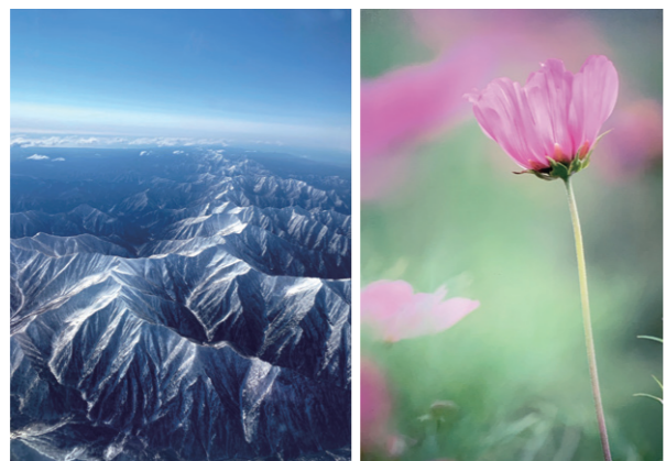
▲写真はコスモスと日高山脈 いろいろな風景写真などを撮りに行ったりもします。患者さんにも好評です。

②次は洗濯機での洗濯です。洗濯物が溜まってくるとつい洗ってしまいます。最近上手になったのはジーンズの洗濯で、シワができませんように洗うことができます。カミさんに教えてもらいました。③休日は月に2回ほどカミさんと一緒にゴルフに行きま