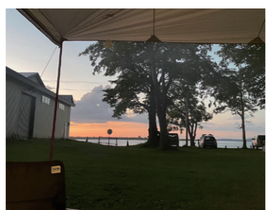
▲休日はアウトドアが好きな夫の影響でキャンプを楽しんだりします。

やりがい・魅力、伝えたいこと 医師の事務の補助というお仕事なので、ある程度の知識が必要で大変なことは大変です。ただ、自分で考えて判断する場面も多いのでその分やりがいはあると思います。学会や勉強会に参加する機会もあ