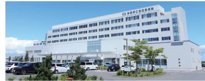
釧路 釧路孝仁会記念病院