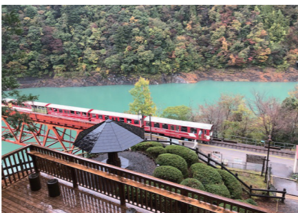
大井川鐵道 奥大井湖上駅

鉄道マニアの中では、いわゆる「乗り鉄」に分類されます。残念ながらローカル鉄道の多くは赤字路線であり、一部は廃線の危機にあります。が、魅力は多岐にわたります。まず、車窓から広がる風景は、喧騒から離れ、自然や地元の色を堪能できます。また、地域の文化や歴史に触れる機会でもあります。古い車両や風情ある駅は時が経っても変わ