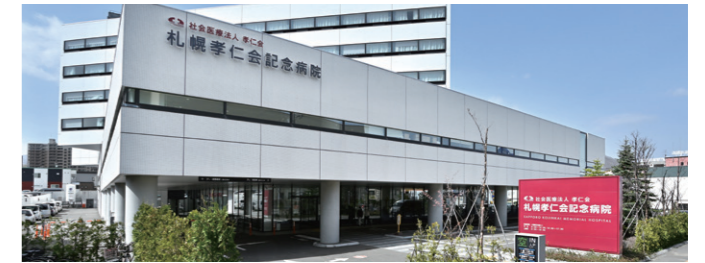
札幌 札幌孝仁会記念病院