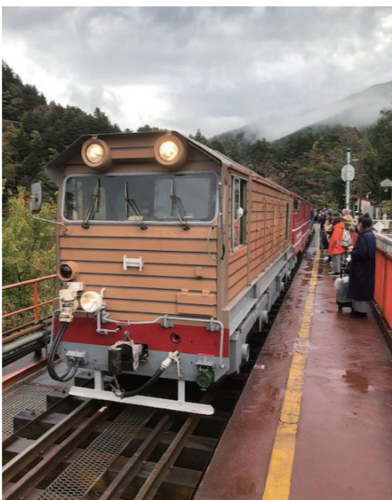
大井川鐵道井川線車両