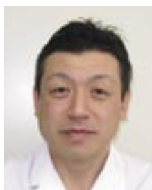
釧路脳神経外科 院長